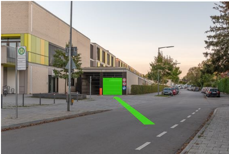
Einfahrt zur Tiefgarage am Anfang der Markgrafenstraße unmittelbar nach der Abzweigung von der Friedenspromenade