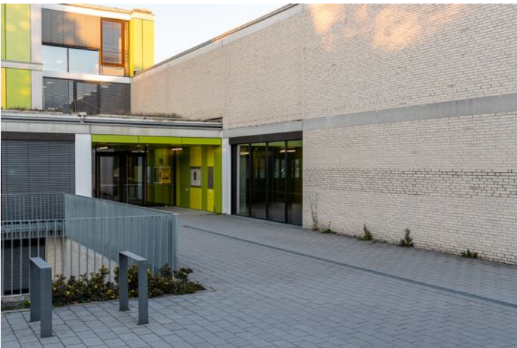
Fußgängerzugang zur Halle an der Markgrafen-, Ecke Vogesenstraße